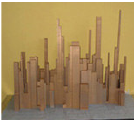
Maquette New York in de maak

In New York staat een gebouw van 50 verdiepingen naast een gebouw van zes verdiepingen of helemaal geen gebouw. Bovendien wijken de torens vanaf een bepaalde hoogte naar achteren. (Wij zijn allemaal erg benieuwd hoe de stedelijke factor eruit gaat zien. Zo'n factor biedt een mogelijkheid om op een andere manier over de hoogte van de gebouwen te praten. Een neutralere taal te vinden die niet gebaseerd is op angst en vijandbeelden, zoals: 'er moeten hele hoge gebouwen komen anders hebben de terroristen gewonnen', maar één die gaat over hoe je wilt dat een stad eruit ziet.) [einde pagina 39]