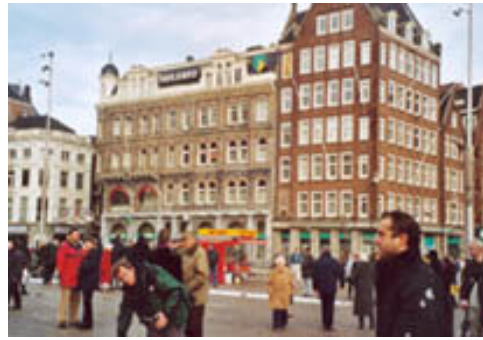
Toeristen helpen mee

En niet van zomaar een plein! Tijdens de voorbereiding van hoeveroost had ik door interviews al gemerkt dat de meeste mensen de Dam als het centrum van Amsterdam beschouwden. Wij beschouwen de Dam als het openbare centrum van Nederland: daar vinden immers alle staatsceremonies plaats. Net als in de Indische Buurt probeerde Netty het emotionele aspect van de ingreep van deze historische gebeurtenis in de publieke ruimte van de stad te materialiseren en met deze materie publieksprocessen te beïnvloeden. Want het ging niet alleen om de interactie met het publiek tijdens het maken van dit mobiele plein. Vanaf elf uur hielpen de toeristen vlijtig mee.