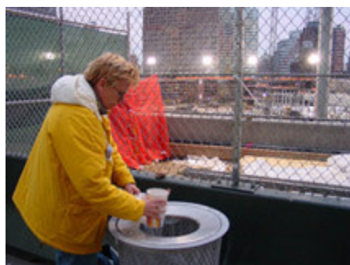
Monsteren van het afval