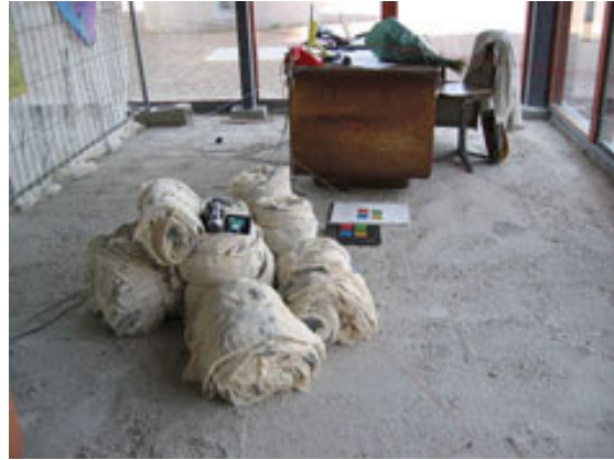
Installatie Dam galerie AHOI, Amsterdam