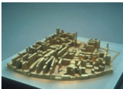
Maquette Indische buurt

In de loop van honderd jaar is er veel veranderd aan het oorspronkelijke stedenbouwkundige plan. Er vond veel nieuwbouw plaats. De publieke ruimte kreeg in die 100 jaar telkens een ander gezicht. Dit kunt u zien in de maquette. [einde pagina 31]