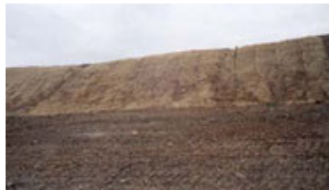
Fresh Kills binnenlanden

Toen we daar arriveerden, bleek er een toegangsweg te zijn met open hek. Voor onze eigen gemoedsrust vroegen we toestemming aan wat vrachtwagenchauffeurs. Een beetje zenuwachtig gingen we op pad. Al snel stuiten we op Corey F sbarra, een lasser die ons graag wilde rondleiden. Nooit eerder waren toeristen geïnteresseerd geweest in een vuilnishoop, aldus Corey. We stapten in zijn auto die vol bier lag.