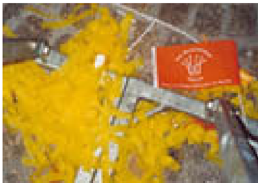
Monster van het koninklijke afval

Na het huwelijk was er een scheiding in landschap en kleur. In het privé-gedeelte van de Dam, slechts toegankelijk voor de genodigden, bevonden zich eilanden van gele en gouden papiertjes.