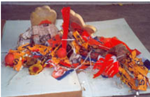
Monster 3 van het publieksafval nagebouwd in mijn atelier

Ik legde de verschillende landschappen vast in een tekening.