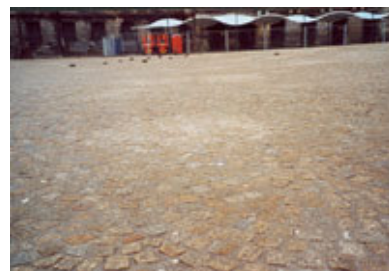
Detail gestofzuigde Dam op 26/01/2002