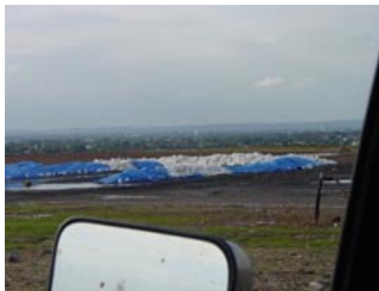
Hill 1/9: de laatste resten in zakken

We passeerden een zojuist verlaten FBI dorp en nadat Corey nog een slok bier had genomen en zijn identificatiekaart tevoorschijn had gehaald reden we opnieuw door hekken langzaam omhoog.