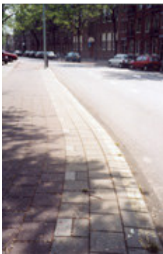
Het gouden randje