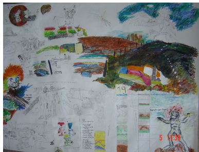
Kaart afvallandschap WTC – Fresh Kills

Het rechterdeel van de tekeningen is een stripachtig verslag van dit avontuur.