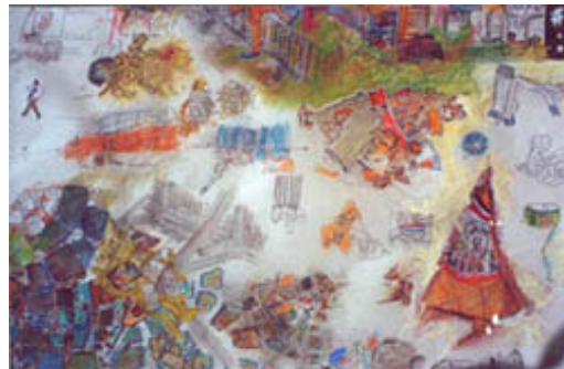
Kaart met monster 3

Via de kaart kan men precies narekenen hoeveel afval er aan het eind van de dag lag en waar dat lag.