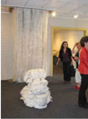
De Mobiele Dam in ISSG