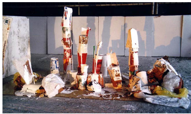
Afvallandschap in galerie AHOI