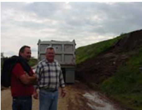
Vrachtwagenchauffeur op Fresh Kills