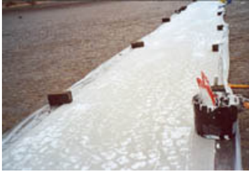
Het maken van de Damafdruk